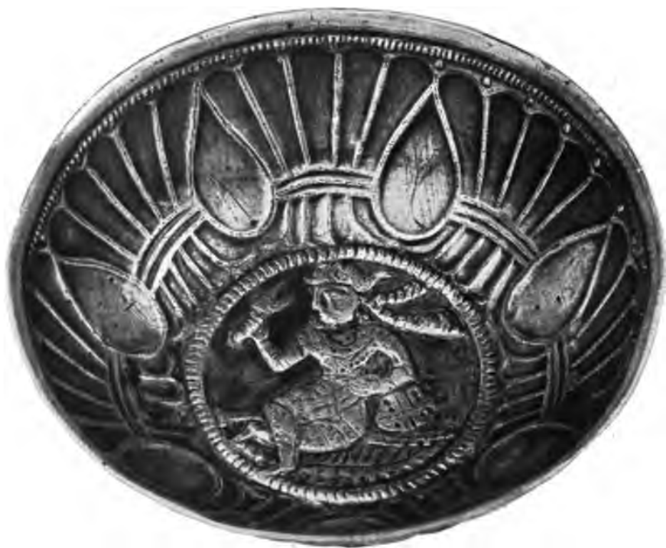
ЧАШКА МУЗЕЯ ОРЕНБУРГСКОЙ УЧЕНОЙ АРХИВНОЙ КОММИССИИ.