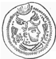
[Рисунокъ № 2].

Въ лѣвомъ ухѣ фигуры —серьга, въ видѣ шарика, разщепленнаго на двое, на подобіе бубенчиковъ въ русскихъ (финскихъ) древностяхъ (см. увелич. вдвое рисунокъ № 4).