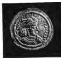
[Рисунокъ № 3].