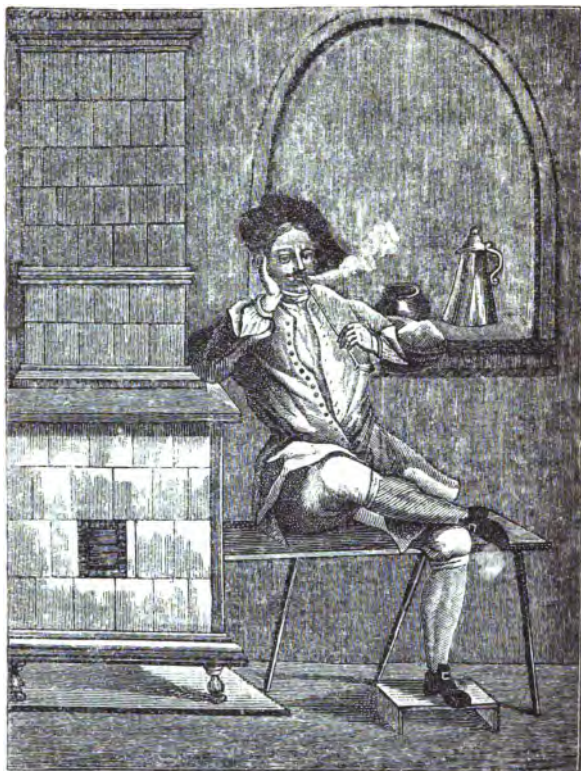
Петръ Великій въ голландскомъ платьѣ.